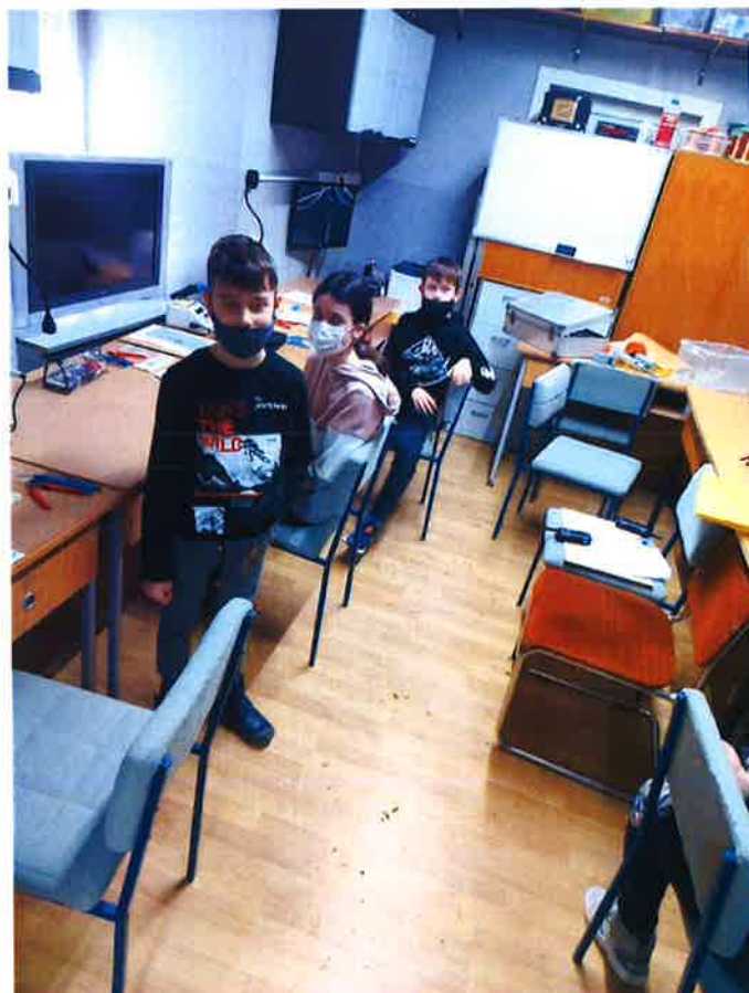
(pripreme za natjecanje radiokomunikacija)