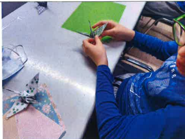
(origami, tehnika izrada predmeta od papira)