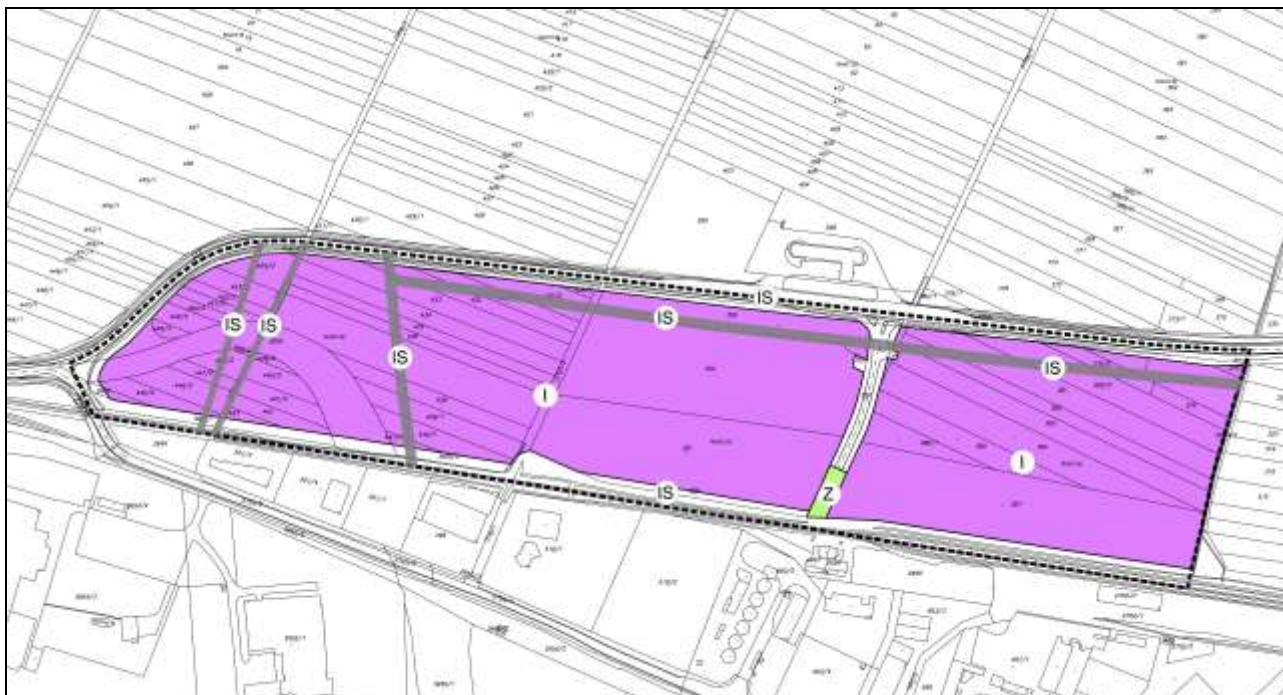
Slika 2: Izvadak iz II. izmjena i dopuna UPU-a Gospodarske zone Sjever, Karta 1. KORIŠTENJE I NAMJENA POVRŠINA