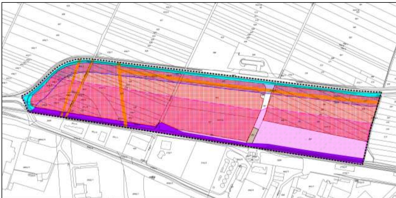
Slika 6: Izvadak iz II. izmjena i dopuna UPU-a Gospodarske zone Sjever, Karta 3. UVJETI KORIŠTENJA, UREĐENJA I ZAŠTITE POVRŠINA