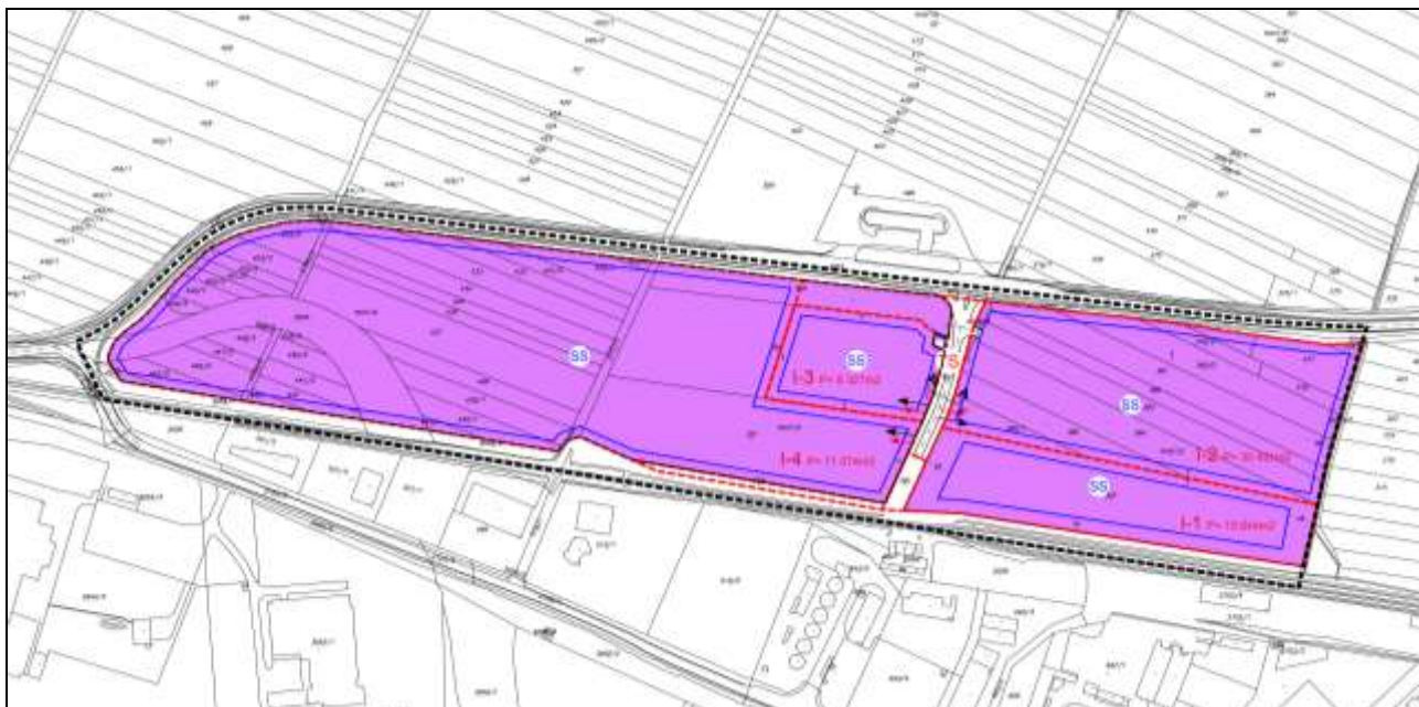
Slika 8: Izvadak iz II. izmjena i dopuna UPU-a Gospodarske zone Sjever, Karta 4. NAČIN I UVJETI GRADNJE