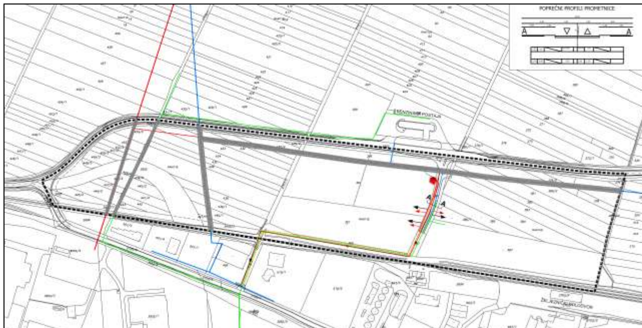
Slika 4: Izvadak iz II. izmjena i dopuna UPU-a Gospodarske zone Sjever, Karta 2. PROMETNA, ULIČNA I KOMUNALNA INFRASTRUKTURNA MREŽA